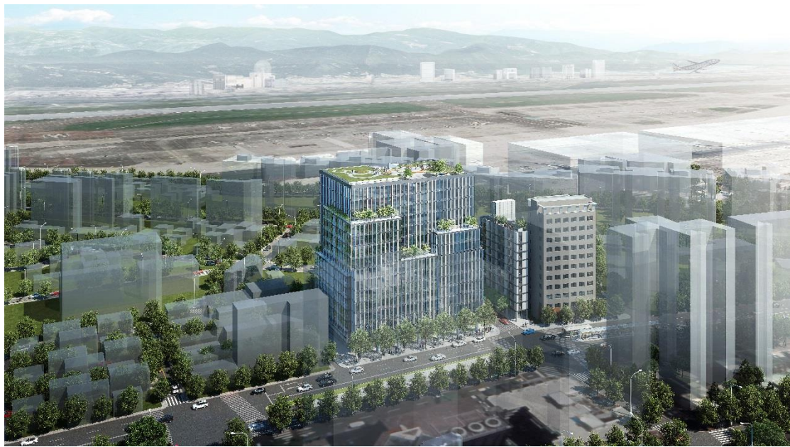
圖 2. 更新後鳥瞰模擬圖