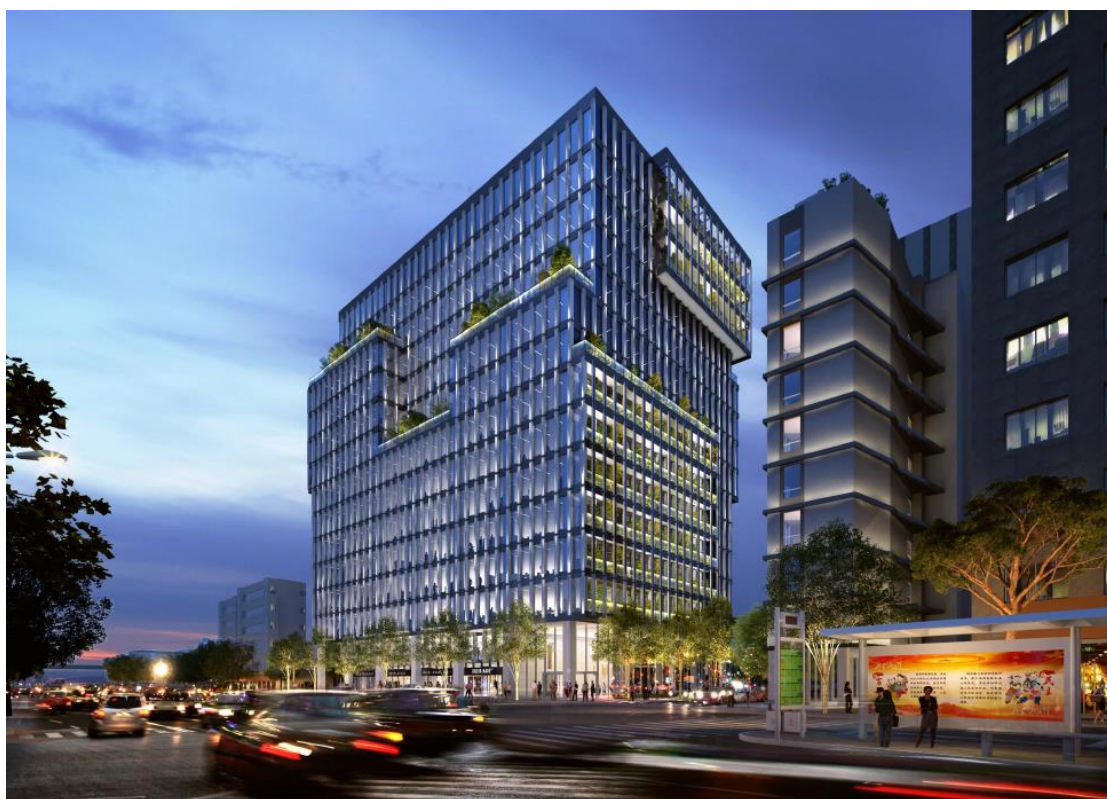
圖 4. 更新後夜間模擬圖