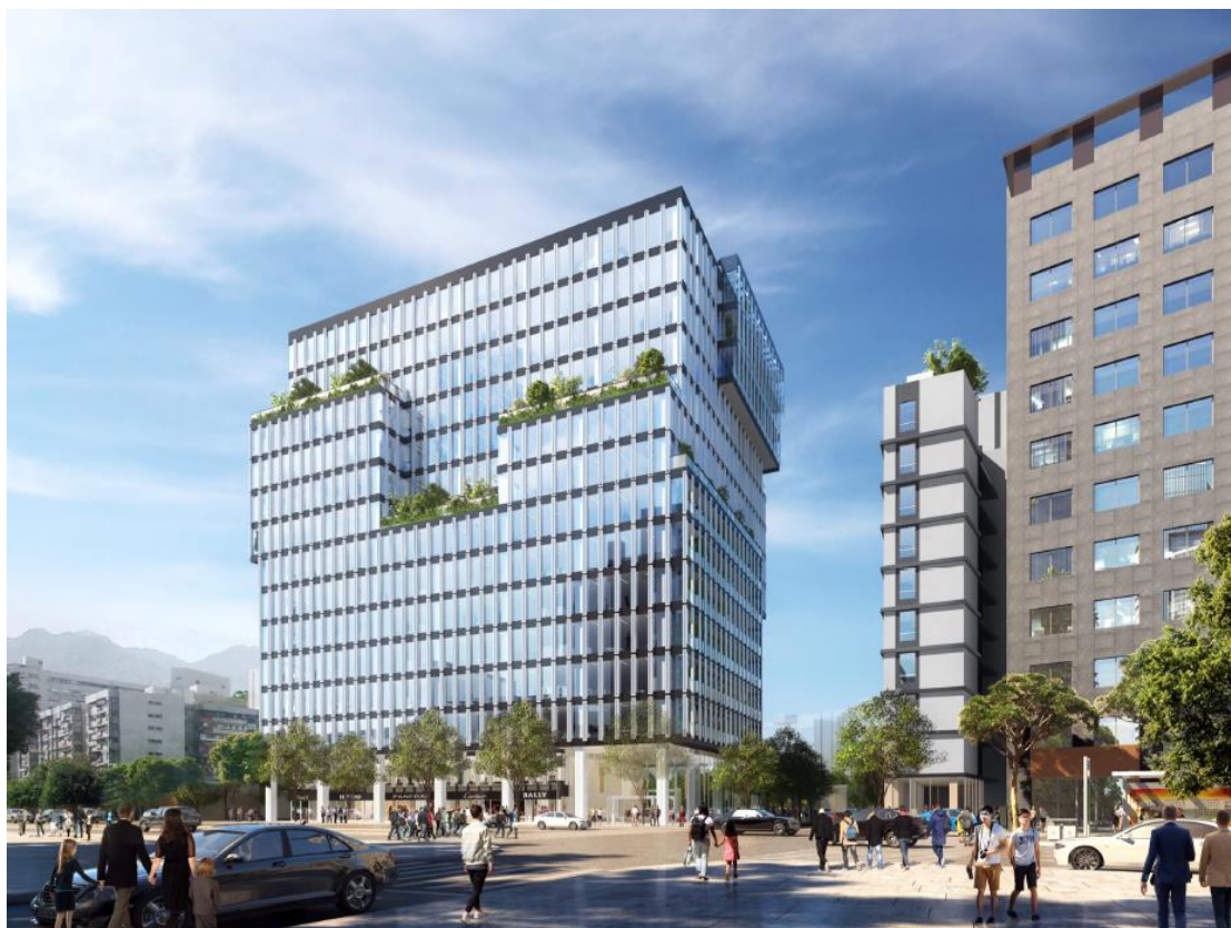
圖 3. 更新後日間模擬圖