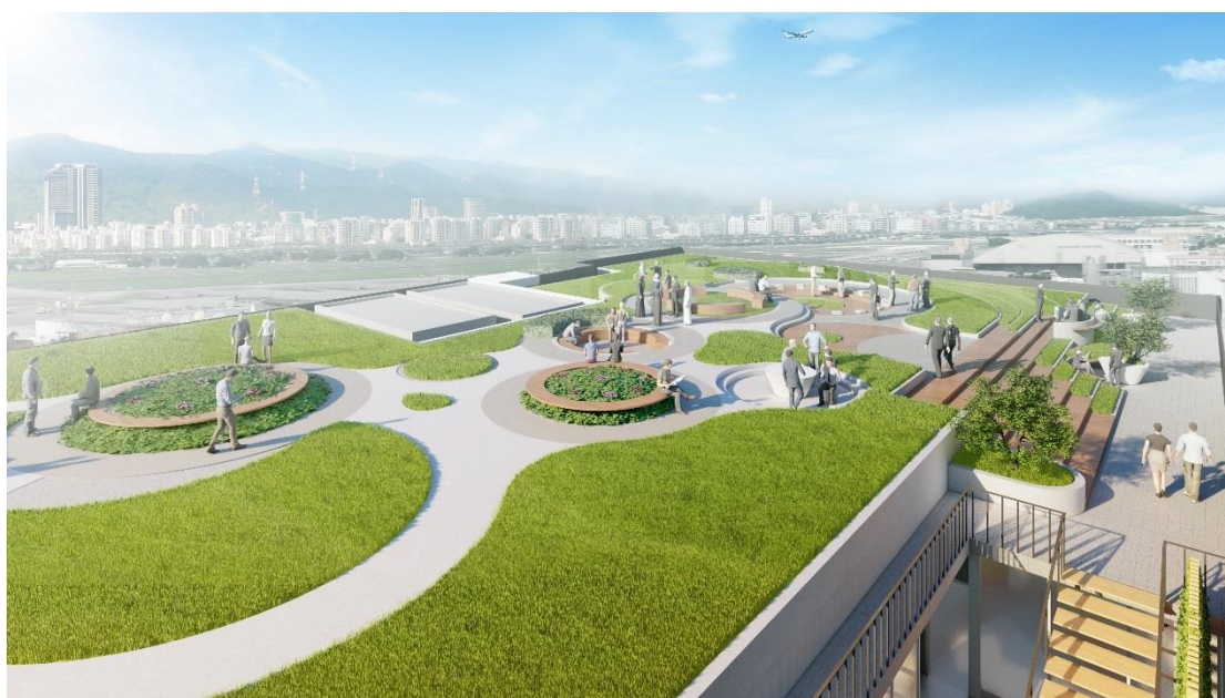
圖 6. 更新後屋頂空間模擬圖